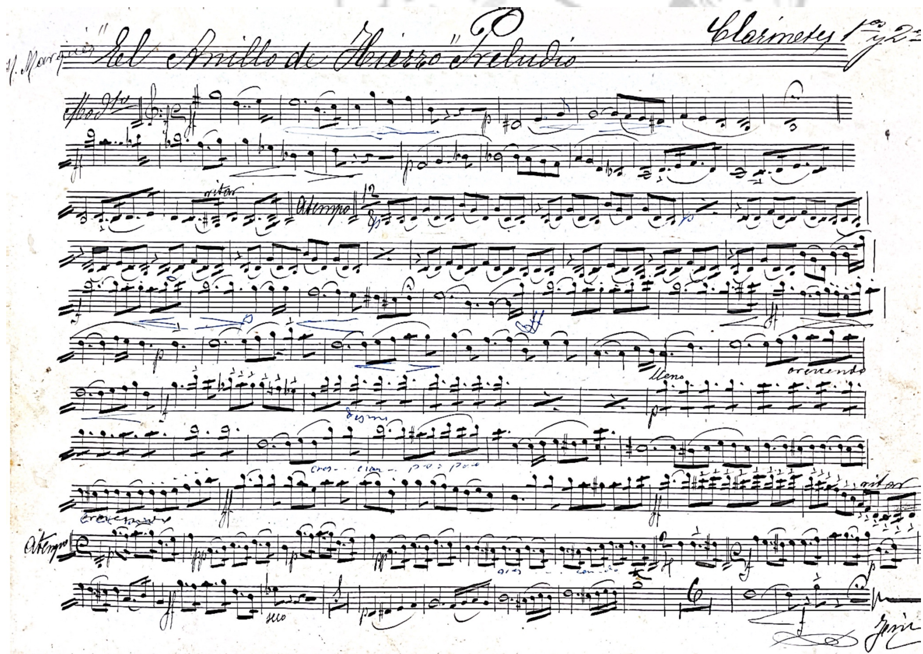
Il·lustració 1. Reproducció de la partitura manuscrita per a clarinets 1 i 2.

Cal indicar en primer lloc que s'ha mantingut la tonalitat emprada a la versió manuscrita per a banda (Fa major) en comptes de recuperar la tonalitat de la versió per a orquestra (Sol major), ja que aquella és més adient per a les tessitures dels instruments de banda.