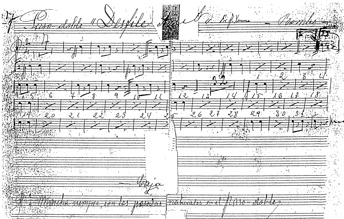
Il·lustració 1. Reproducció de la partitella manuscrita per a la percussió, on es pot veure que originalment la caixa tocava “sempre marxa, amb les passades naturals del pasdoble”.

Per acabar cal indicar que les partitures manuscrites descriuen aquesta obra com a “paso-doble”, que volia dir que era per a desfilar a pas al doble de velocitat, és a dir a 120 passes per minut. No hi ha que confondre aquesta indicació amb un pasdoble per a esser ballat. Per això s’ha decidit indicar a la partitura que es tracta d’una “marxa”, a més de incloure-hi la indicació de velocitat.